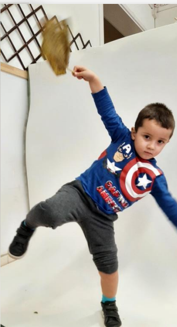
FOGLIA BRACCIO GIU' D.A.