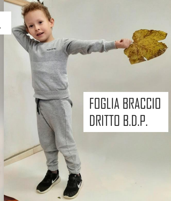
FOGLIA BRACCIO DRITTO B.D.P.