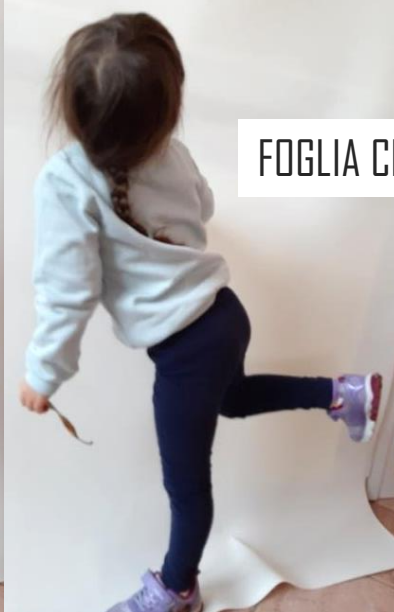
FOGLIA CHE DA' UN CALCIO