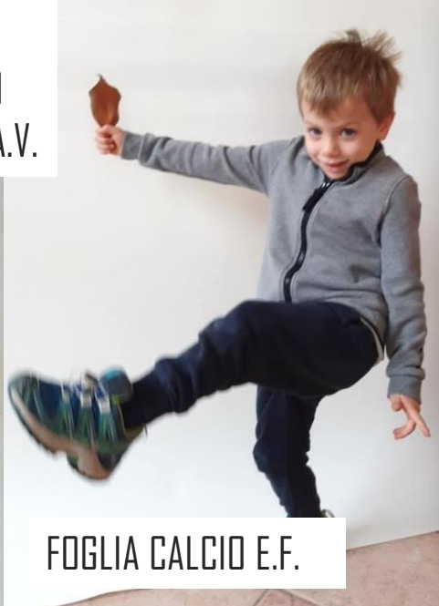
FOGLIA CALCIO E.F.