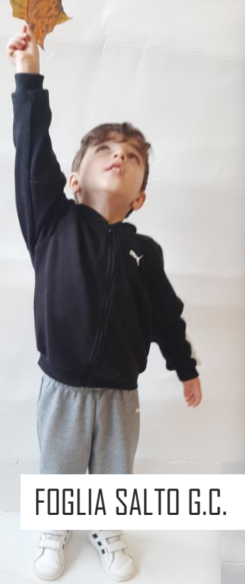
FOGLIA SALTO G.C.