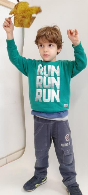
FOGLIA CON BRACCIO A FIOCCO C.D.M.