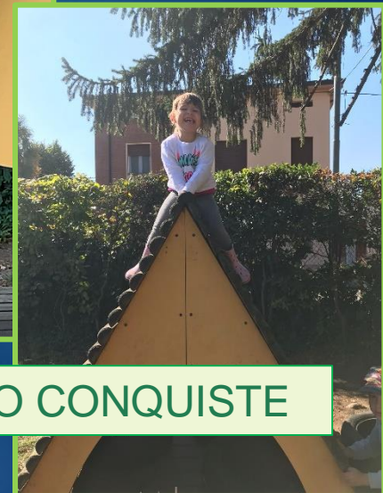
SI FANNO CONQUISTE