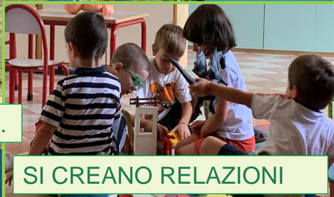
SI CREANO RELAZIONI