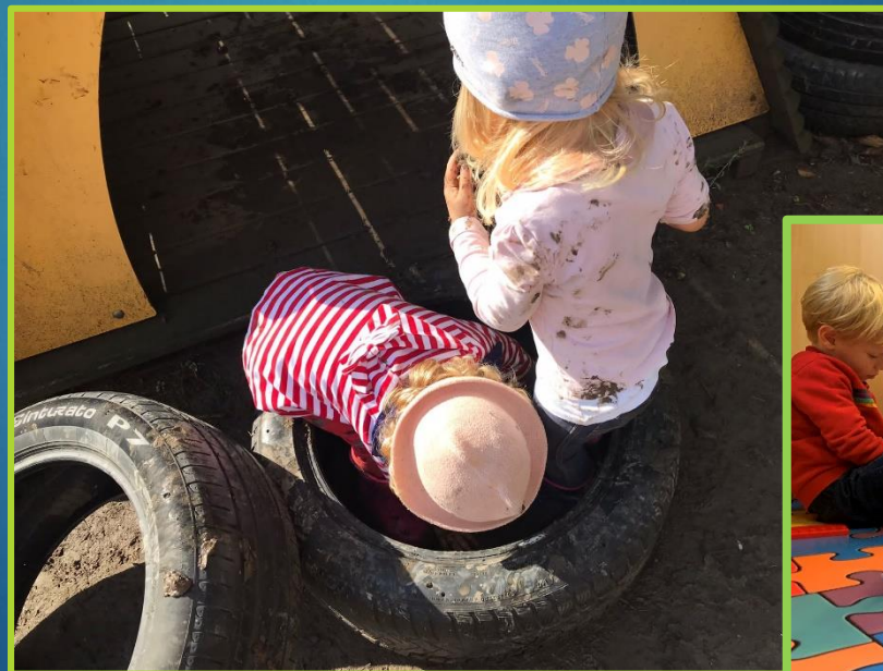
GIOCHI IN GIARDINO E IN SEZIONE