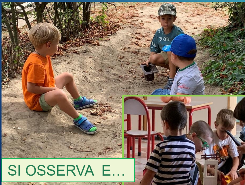
SI OSSERVA E...